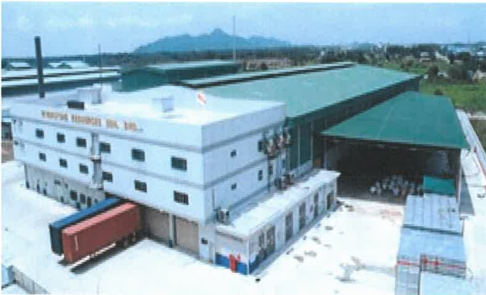
Riverstone Resources Sdn Bhd Gloves Factory in Kamunting, Perak