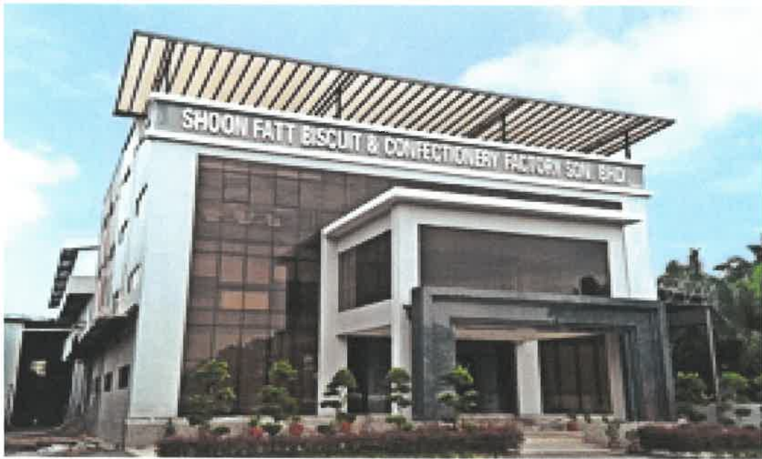
Shoon Fatt Biscuit & Confectionery Sdn Bhd Office & Factory In Teluk Intan, Perak