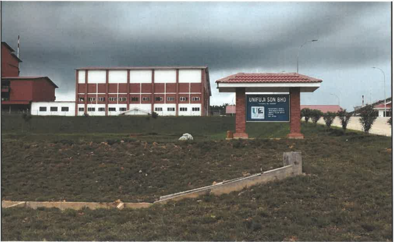
UniFuji Sdn Bhd Factory In Ulu Bernam, Perak