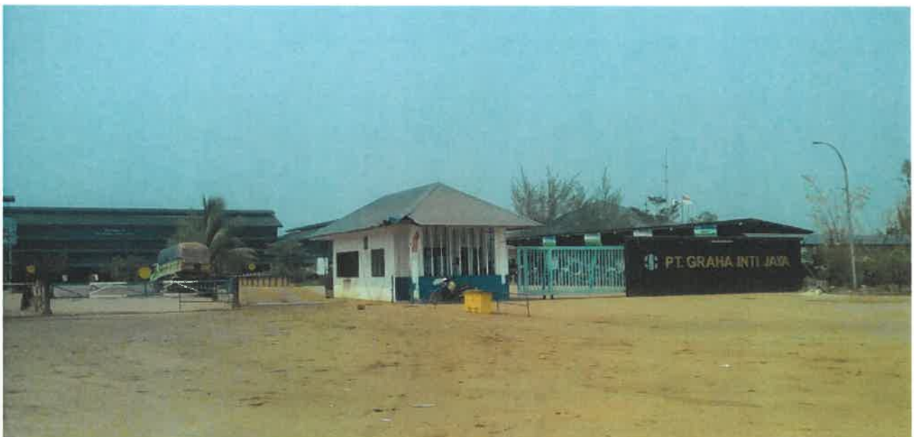
PT Graha Inti Jaya Palm Oil Mill In Kapuas, Kalimantan Tengah, Indonesia