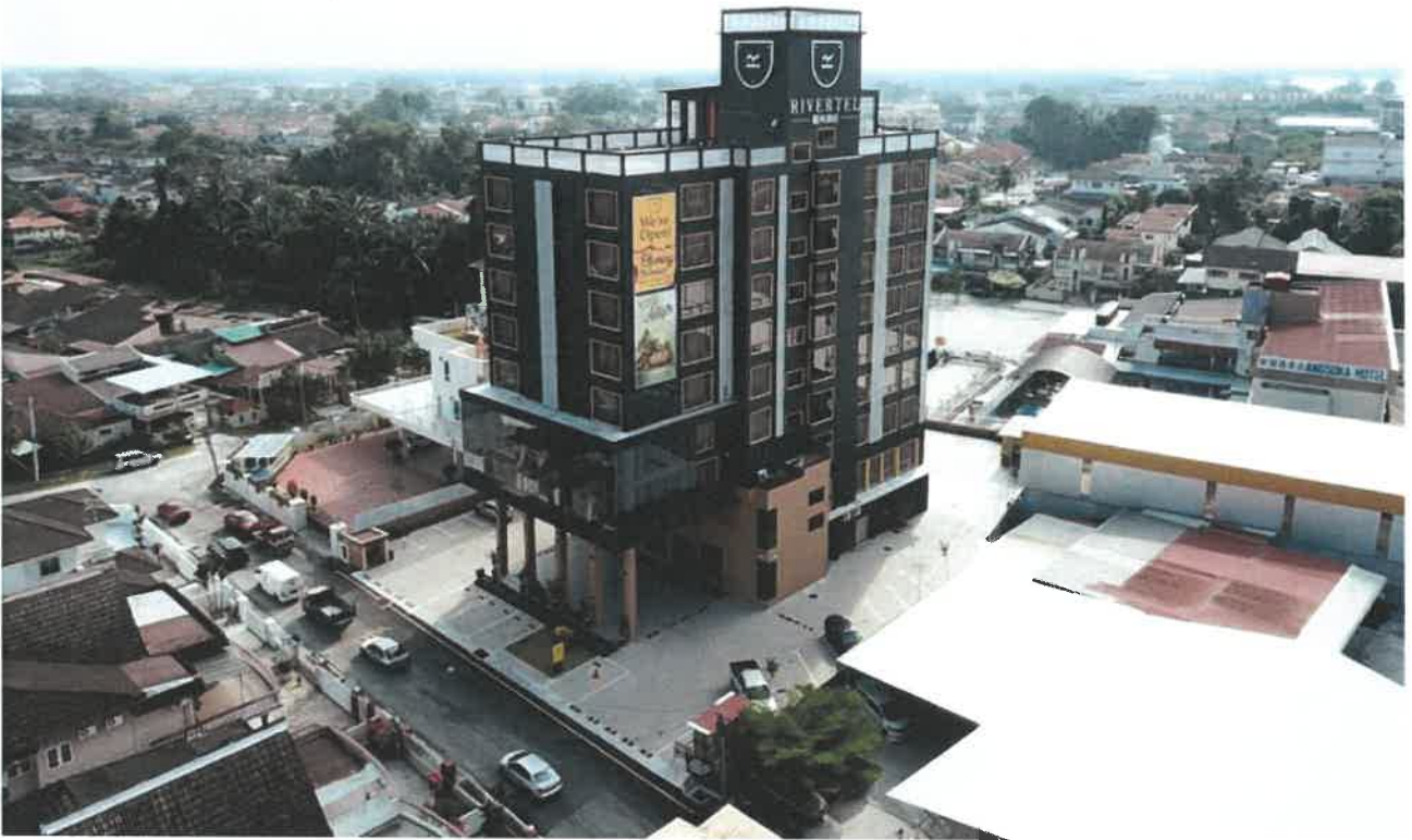
Rivertel Hotel In Teluk Intan, Perak