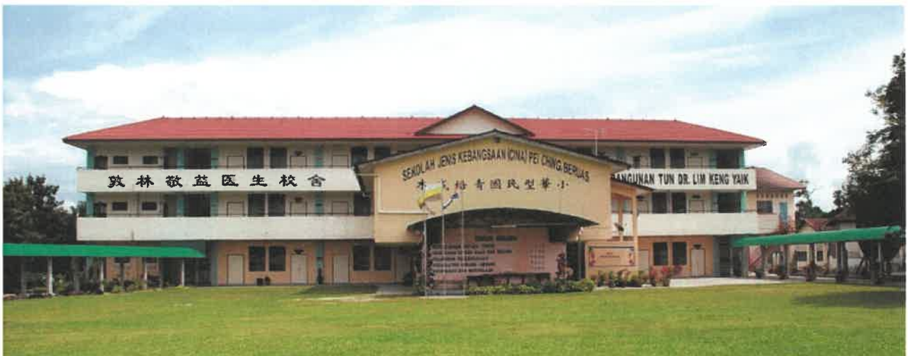
SJK [C] Pei Ching, Beruas, Perak