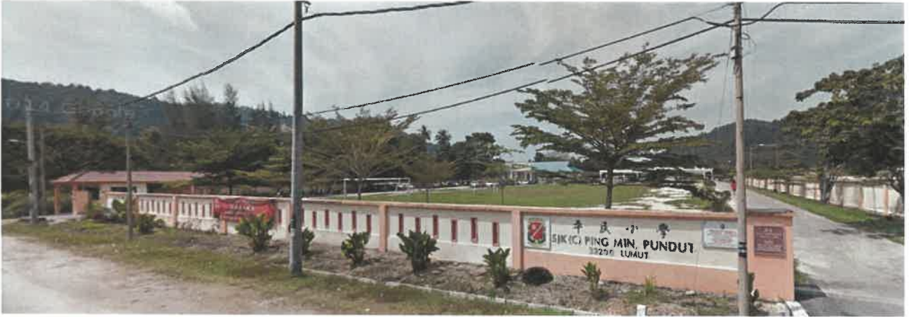
SJK [C] Ping Min, Lumut, Perak