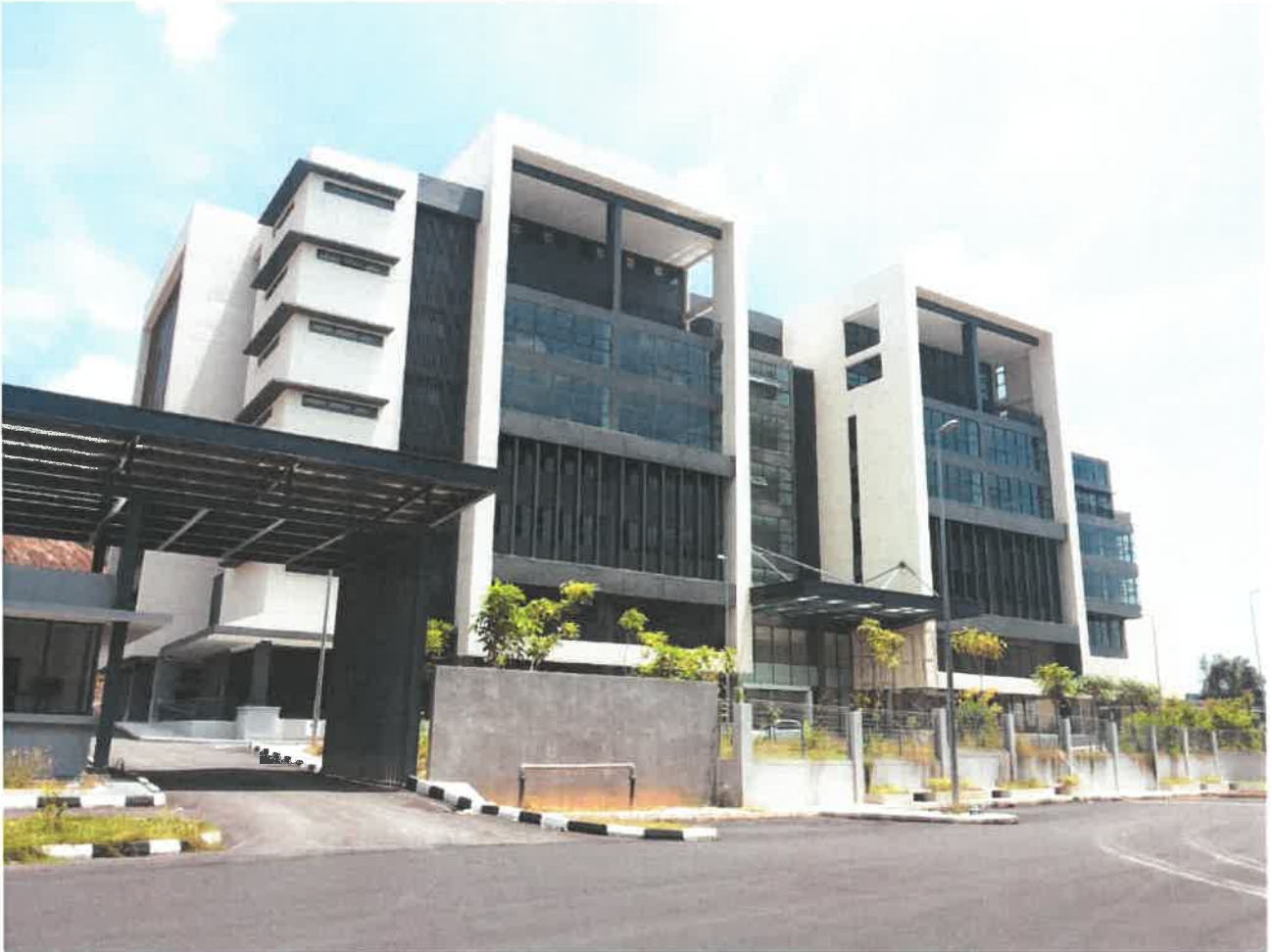
Segi College / Peninsula International School In Ipoh, Perak