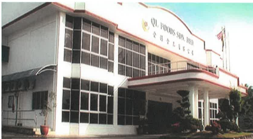
QL Foods Sdn Bhd Factory In Hutan Melintang, Perak