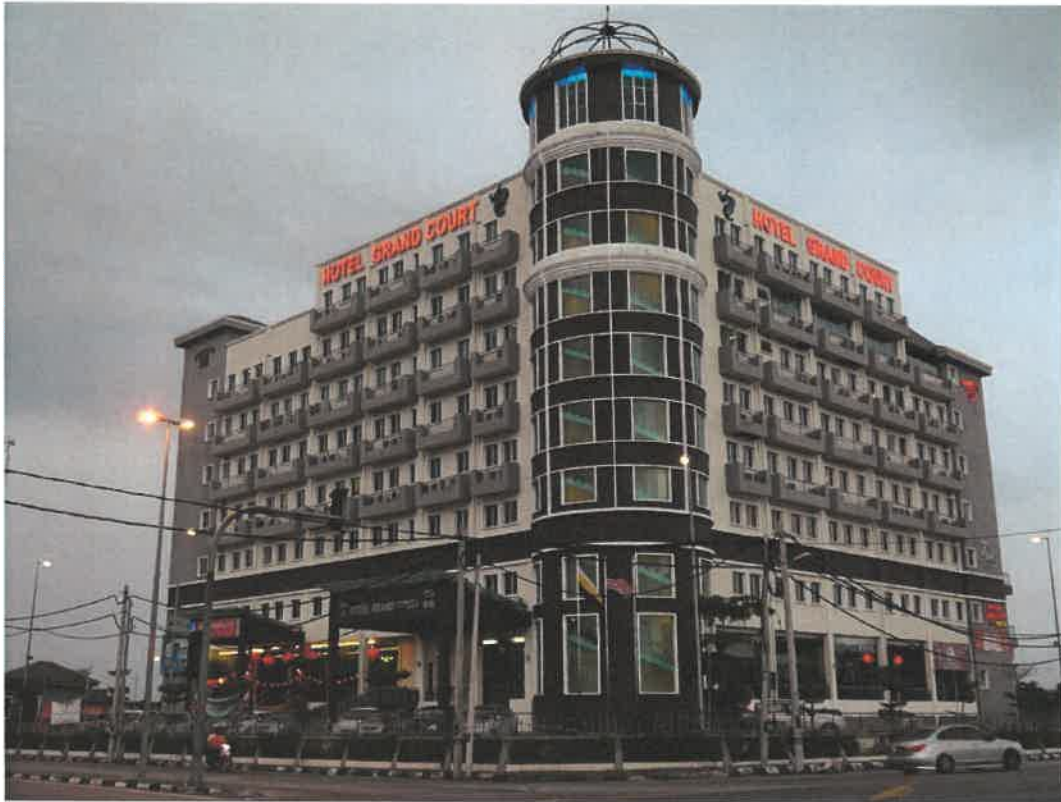
Grand Court Hotel In Teluk Intan, Perak