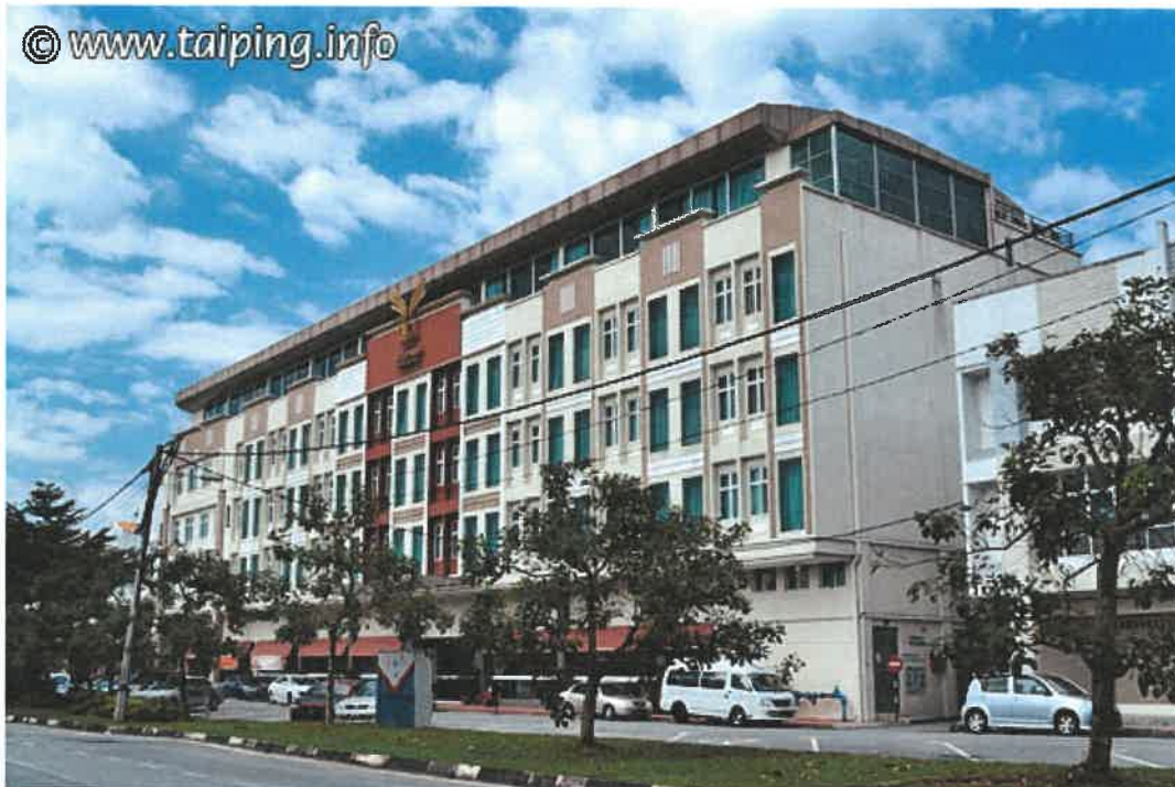
SSL Traders Hotel In Kamunting, Perak