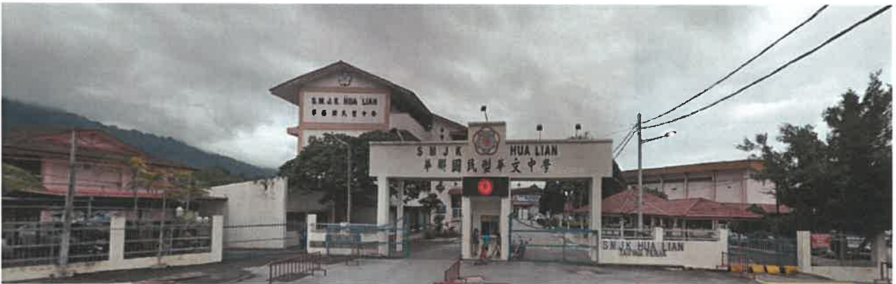
SMJK Hua Lian, Taiping, Perak