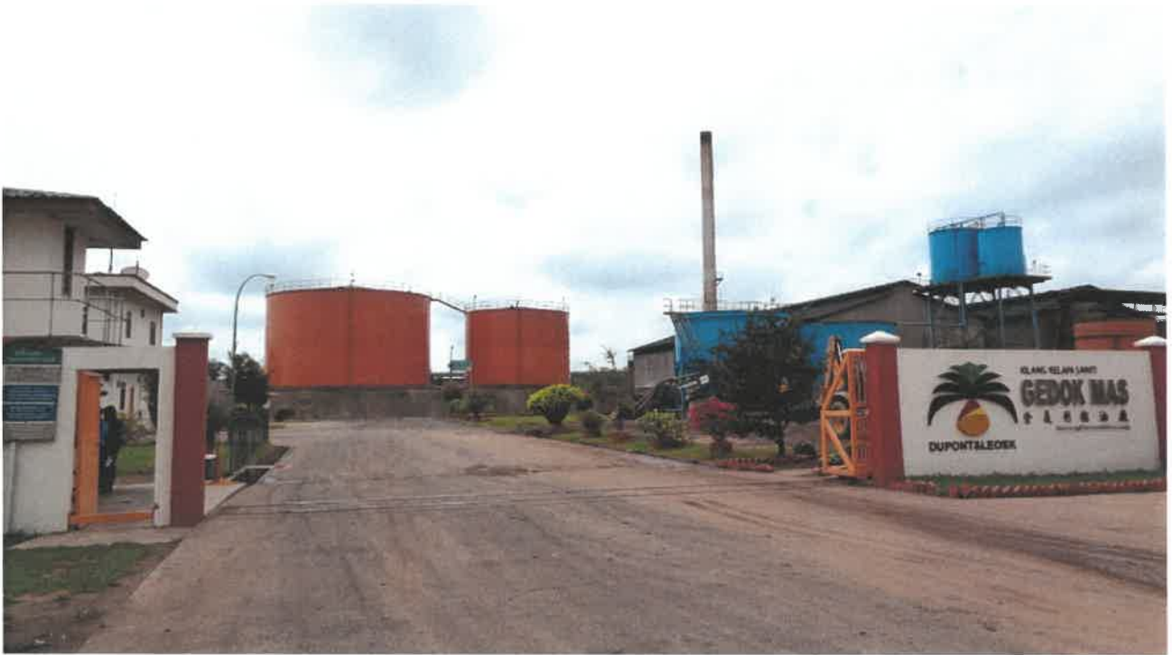
Dupont & Leosk Enterprises Sdn Bhd Palm Oil Mill In Gemencheh, Negeri Sembilan