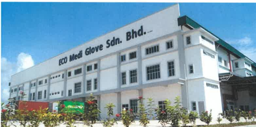
Eco Medi Glove Sdn Bhd Gloves Office & Factory In Kamunting, Perak