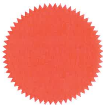
(Ir. KAMALUDDIN BIN HAJI ABDUL RASHID) Yang Dipertua

Perakuan pendaftaran ini akan habis tempoh pada 31 Disember 2020