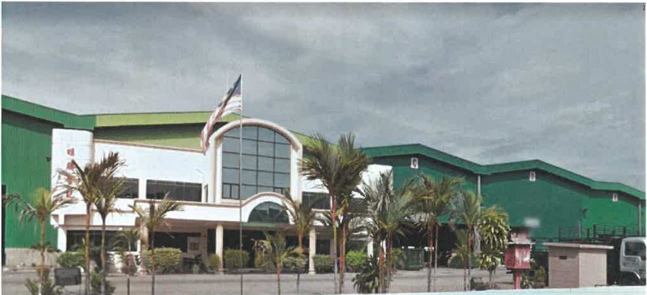
MSHK Engineering Sdn Bhd Factory In Ipoh, Perak